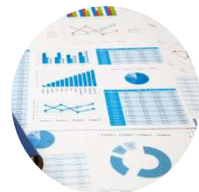
Envoi trimestriel des reportings de gestion et outil de suivi à J-1