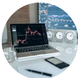
Monitoring quotidien du portefeuille