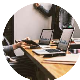
Réunions régulières entre le conseiller et l'équipe de gestion